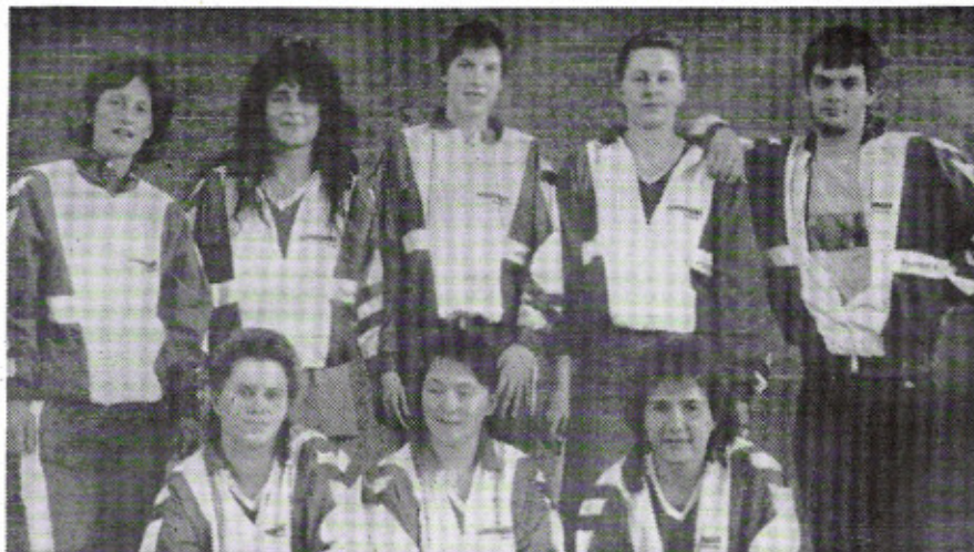
Die Lamstedter Basketballerinnen gewannen das Bezirkspokalendspiel gegen VfL Stade.